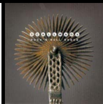
ROCK'N'ROLL RODEO (CD 2000)