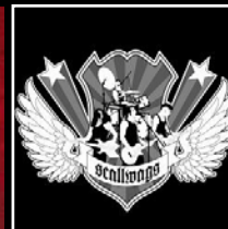
SCALLWAGS (LP 2005)