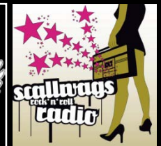
ROCK'N'ROLL RADIO (CD 2006)